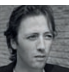
Joris van Casteren Tweede deel van een serie over new towns en uitbrei- dingswijken in Europa