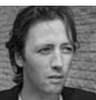
Joris van Casteren Vierde deel van een serie over new towns en uitbrei- dingswijken in Europa