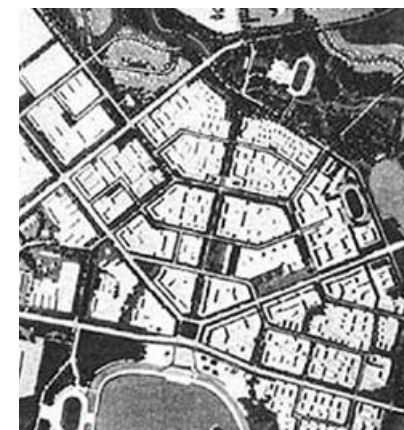
OVERZICHT NOWA HUTA