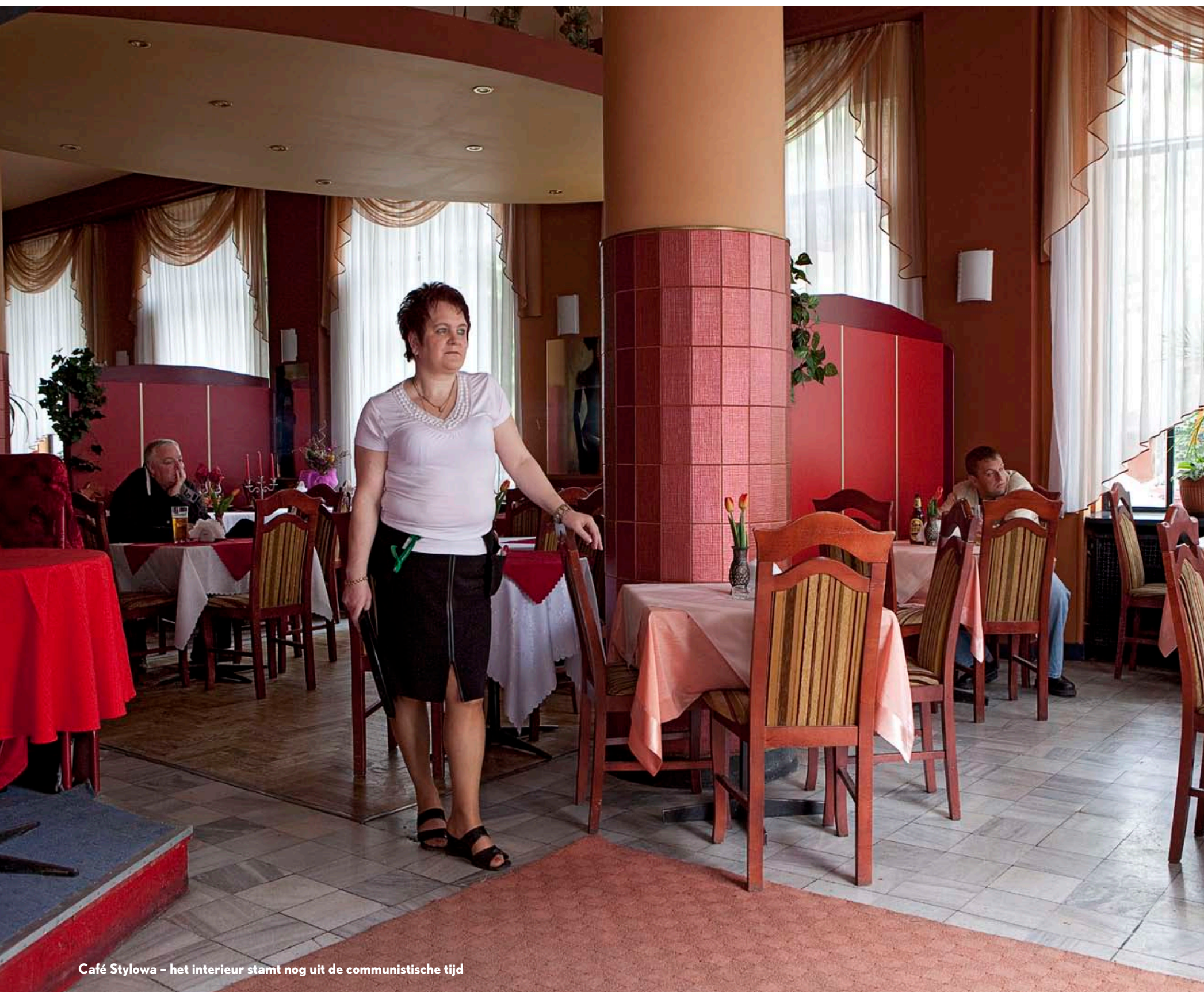
Café Stylowa – het interieur stamt nog uit de communistische tijd

Haar man had een belangrijke functie in de fabriek. Ze woonden in de statige C-32-buurt, waar alleen partijleden woonden. Na de vrije verkiezingen van augustus 1989 verloren ze hun bevoorrechte positie. Noodgedwongen betrokken ze het kleine appartement in huizenblok 21. 'Nowa Huta is verpauperd, schurken zijn aan de macht.'